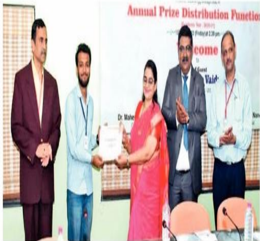
Student being felicitated by dignitaries.

Every year, the college honours students who