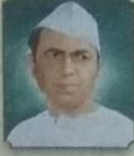
सहकारमहर्षी के. तात्यासाहेब बोरस्ते