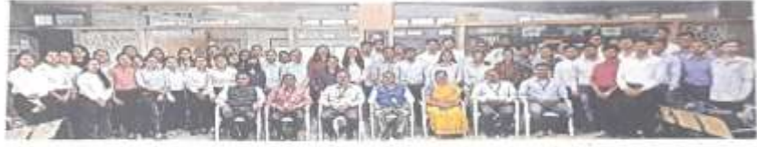
ई. अॅण्ड टी. सी. शाखेच्या ८५ विद्यार्थ्यांना आयटीसह महिंद्रा, रिलायन्स, अदानी ग्रुपमध्ये नोकरीची संधी मिळाली.

अभियांत्रिकी शिक्षणातील इलेक्ट्रॉनिक्स शाखेच्या टेलिकम्युनिकेशन शाखेच्या विद्यार्थ्यांना प्रथमच एकाच वेळी मोठ्या संख्येने नोकरीच्या संधी मिळाल्या आहेत. ई. अॅण्ड टी. सी. शाखेतील ८५ विद्यार्थ्यांना महिंद्रा अॅण्ड महिंद्रा, रिलायन्स, प्राज, क्रांन्टन प्रोटेक्ज, बीश, इमर्सन, हिंदुजा टेक, फ्लुरन्सिसा व अदानी ग्रुपमधील कंपन्यांत प्रोडक्शन, मटेन्न्स, डिझाइन या पदांवर प्लेसमेंट मिळाली आहे. तर आयटी क्षेत्रातील इन्फोसिस, टीसीएस,