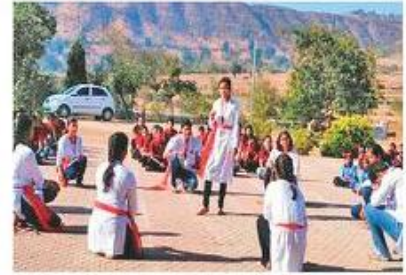
पथनाट्य सादर करताना प्रयास संस्थेचे सदस्य.