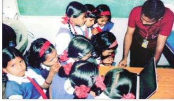
नाशिक येथील क. का. वाघ अभियांत्रिकी महाविद्यालयातील विद्यार्थी लॅपटॉपव्दारे संगणकाचे शिक्षण देताना.

पेट परिसरातील २६ शाळांमध्ये 'प्रयास २०१६' हे पाचदिवसीय निवासी शिबीर घेण्यात आले. शिबिरांतर्गत करजाळी केंद्र आणि कोहोर केंद्र यामधील जिल्हा परिषद शाळा आणि दोन शासकीय आश्रमशाळांमध्ये मार्गदर्शन