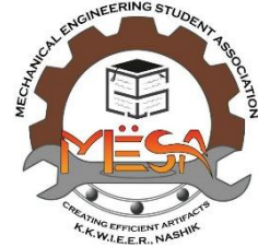
Mechanical Engineering Student's Association