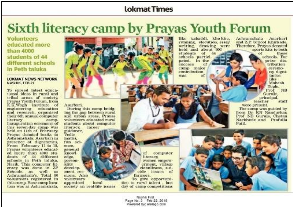
Prayas Youth Forum coverage in English Newspaper- Lokmat Times