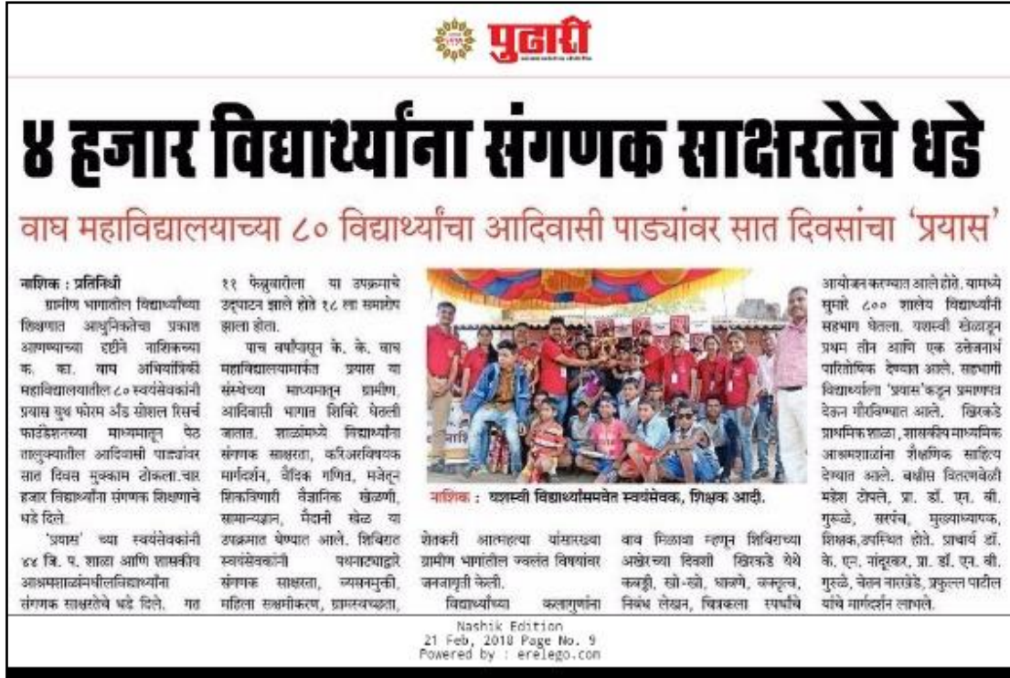
Prayas Youth Forum coverage in regional newspaper- Pudhari